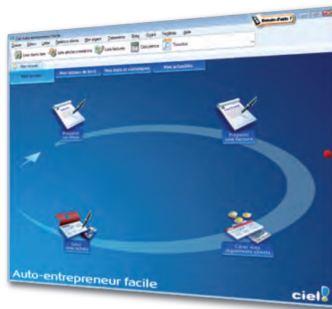
Ciel Auto-entrepreneur Facile - Windows.

Suivez le guide ! INTUICIEL® vous propose les principales étapes du cycle de gestion de votre activité.